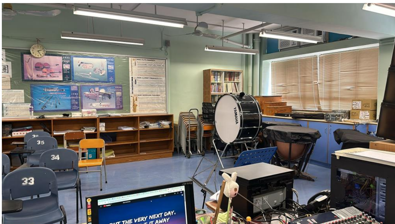
現有新裝修的混音室（附件二）