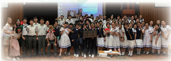
Treasure Hunt 2017 - Our Jolly Buccaneers