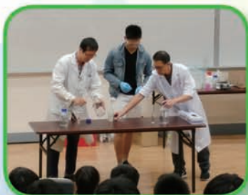
本校學生與浸大教師一同示範化學實驗