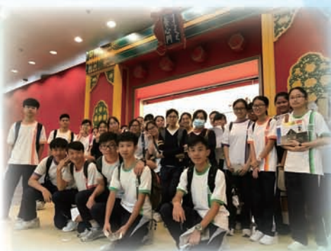
參觀沙田文化博物館

為擴闊學生的文化視野，視藝科與中文科合作舉辦沙田文化博物館參觀活動，帶領中四全級學生參觀徐展堂展覽館及粵劇館，加強對中國文化的認識，適逢博物館正舉辦「羅浮宮的創想」，展出羅浮宮多項珍品，是難得的學習體驗。