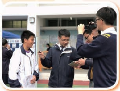
關心香港政制事務，建立理性的時事討論平台。