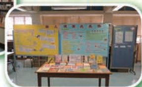
踏上健康成長路專題展覽