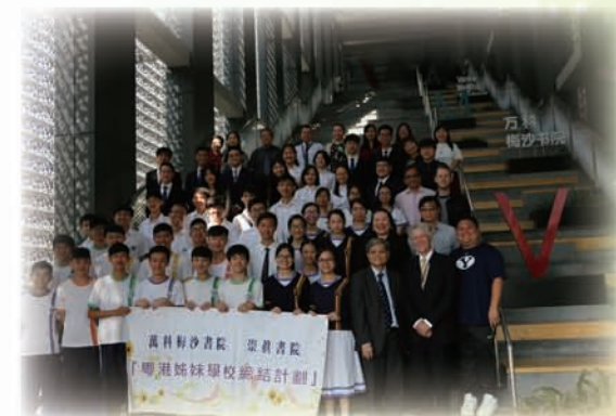
與姊妹學校萬科梅沙書院的師生來一張大合照