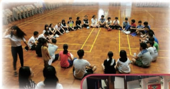
領袖生團隊訓練營

領袖生招募及新任領袖生訓練營於六月舉行，地點為本校禮堂。同學不單認識日常訓導工作，更能與來年的正、副領袖生共同協作解難。這除了提升團隊默契外，更培養領袖生長的領導才。