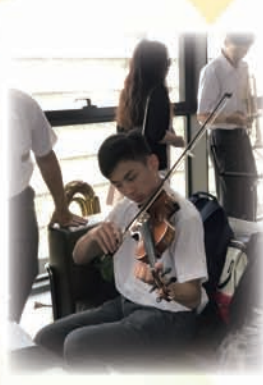
崇真樂團表現出色