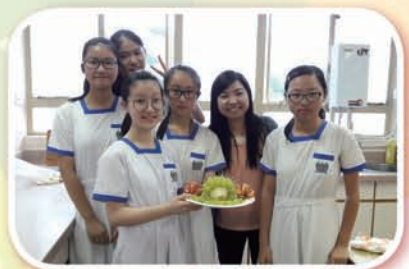
班際水果拼盤設計比賽

本校於2017年4月26日舉辦本學年「開心果日」，活動包括中二班際水果拼盤比賽、電視早會宣傳開心果日。