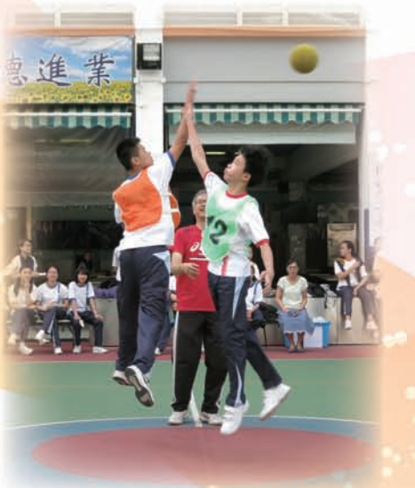
學生全情投入中一聯班閃避球活動

本年中一聯班閃避球活動已於 2017 年 6 月 27 日舉行，透過閃避球比賽訓練中一級議員領袖能力，學生積極參與，過程順利。