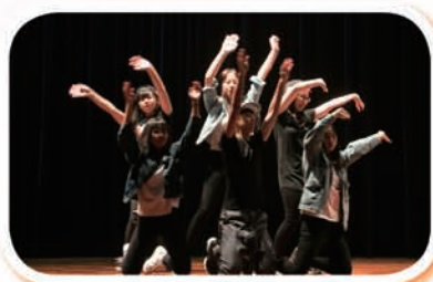
社際天才表演——現代舞

一年一度「天才表演」於7月7日舉行，當天分別以社際及團體形式比賽，各社盡派精英參加。結果由信社勇奪冠軍，亞軍、季軍分別為義社及達社。