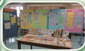
古文明探索專題展覽