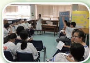
「心靈勵志」好書分享會

為推廣閱讀風氣，圖書館邀請中三至中五同學擔任閱讀大使，為中一同學統籌以「小說欣賞」、「心靈勵志」及「各行各業」為題的好書分享會。閱讀大使會據主題選取好書於分享會以輕鬆有趣的方式作分享，增加同學對該題材的閱讀興趣，從而借閱相關的圖書。