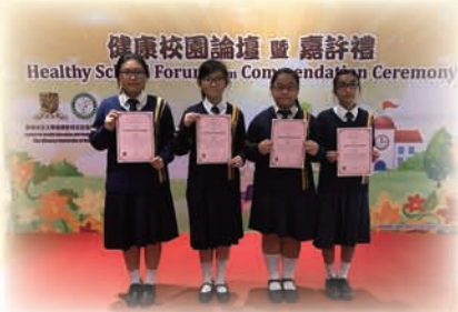
本校健康軍團成員獲中文大學健促中心嘉許

本校於2017年2月11日(星期六)，參加由香港中文大學醫學院賽馬會公共衛生及基層醫療學院健康教育及促進健康中心舉辦之〈真的想高飛〉健康校園論壇暨嘉許禮 2017。當天四名崇真健康家族領袖獲嘉許並代表學校向「生力軍培育計劃」的學生健康軍團和地區支部幹事分享崇真健康推廣活動。