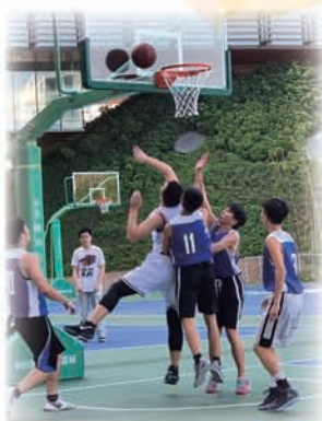
雙方高技術的切磋，球來球往，令全場氣氛高漲。

當天，本校的籃球隊員表現出色，紀律嚴明，令全場氣氛高漲。而崇真樂團的表演內容則非常豐富，有古典樂章演奏，亦有流行卡通主題曲獻唱；而英詩朗誦的同學，亦準備充裕，朗誦時抑揚頓挫，活玩故事的情節，是一次難能可貴的交流活動。