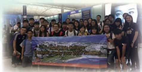
Study Tour 2017 - English Study Tour to Cairns

in Australia first hand. All of the participants indeed gained a lot of valuable experience, especially through the host family arrangement and the buddy program; very positive feedback was received in the program evaluation.