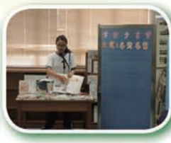
「各行各業」好書分享會