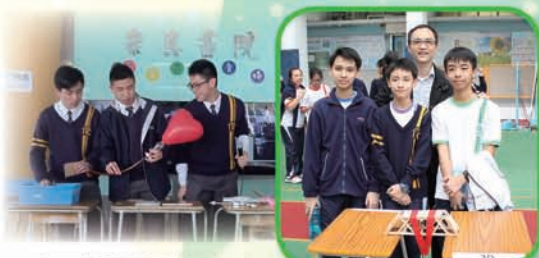
中四化學班同學向初中學生示範氫氣的實驗

2017 年 2 月 20 日至 24 日為本校的數理科技周，除有多個由高中學生主持的科學活動供初中學生參與外，還有各項科學比賽，讓全校師生感受科學的趣味。