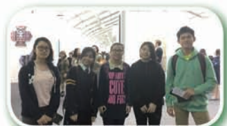
參觀 Art Central 展覽

Art Central 展示了精采的藝術節目，表現了亞洲當代藝壇的活力一面，當中包括大型裝置、實驗電影及前衛的表演。三月份，熱愛藝術的同學趁統一測驗過後，到中環參觀有關展覽，接觸不同類型的藝術創作和藝術表現，擴闊眼界及提昇藝術修養。