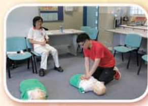
教職員參與急救課程