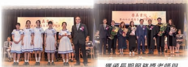
主禮嘉賓頒發畢業證書與中六畢業生