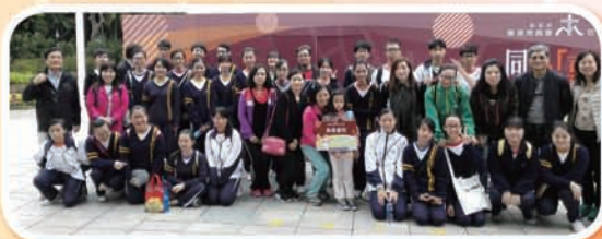
崇真會同心喜步 2017 籌款活動

蒙上帝的祝福，2月19日崇真會舉辦的「同心喜步籌款活動」順利完成，屬會各單位齊心募集善款，參與大埔海濱公園的步行嘉年華。本校共有 54 名老師、家長及學生代表出席步行活動，全校籌得 $27,934.10 圓正。