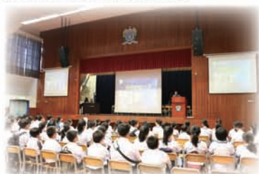
中一同學在禮堂出席教學講座

為了讓中一同學盡快適應中學生活，並強化他們的學習基礎，本校於8月21日至9月4日期間，舉行「中一橋樑課程」，所有中一新同學必須出席。橋樑課程舉行期間，中一新生須參加英文課程，以提升其英語水平；同時，透過各科組主辦的講座及活動，使中一新同學對本校的歷史及校園生活各方面的情況均有所認識，並漸而建立他們對學校的歸屬感。