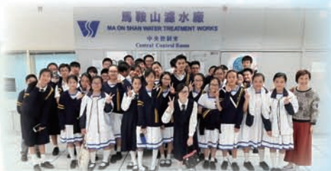
中一 D 班參觀馬鞍山濾水廠

2017 年 4 月 6 日，1D 班利用多元學習堂前往馬鞍山濾水廠參觀，從實際環境中學習課程中有關食水處理的課題。