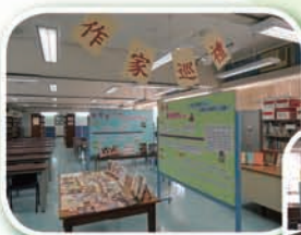
作家巡禮專題展覽