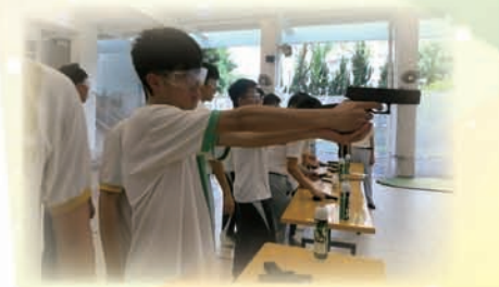
學生專注學習射擊

活動於5月12日舉行，此活動是與協和書院合辦，讓中三及中四學生透過射擊活動來舒緩讀書壓力。