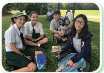
Study Tour 2017 - TTC students experiencing Australian school life