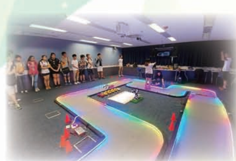
學生利用肢體動作控制搖控車的活動

2017年7月6日本校修讀化學科的同學參觀浸會大學理學院，期間參與了化學實驗及參觀了電腦學系的實驗室。