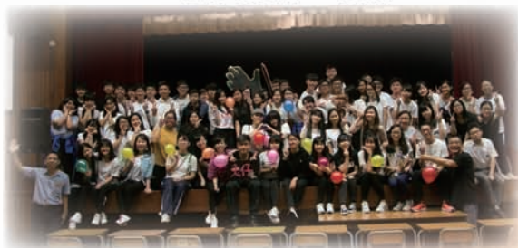
社際天才表演——台前幕後全體人員