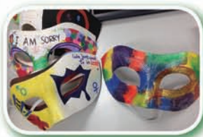
面具設計比賽參賽作品

愛滋寧養服務協會於2011年首度舉辦面具設計比賽，以面具作為愛滋病感染者懼怕公開病情及自我保護的象徵；並邀請學生及公眾人士透過創作面具，認識愛滋病及愛滋病感染者所面對的困難，從而消除歧視。本年度的主題為「向歧視說不 繪出平等社會」，同學以繽紛的色彩設計面具，希望為感染者送上祝福，並引起公眾人士關注。