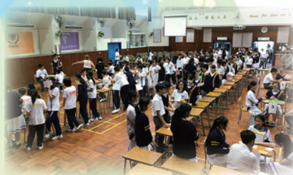
Word Champion 2017 - The Crowded Hall

The Word Champion, a vocabulary competition in which students faced off in "Spellink" duels to compete for the highest scores and prizes, was held in May 2017. The activity was very popular among all students. In merely four sessions of activity, a total of 1791 entries were registered, achieving a total score of 1,051,600 points and a participation rate of 63.7% in the junior forms.