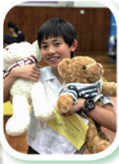
Word Champion 2017 - Prizes