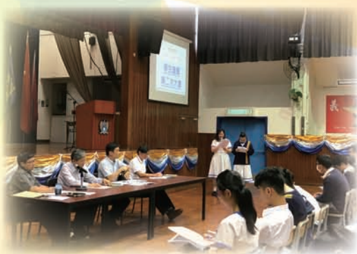
學生議員全情投入學生議會會議

本年度中一新生校園遊已於 2017 年 9 月 2 日舉行，讓中一新生認識校園，氣氛良好。