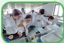
學生在大學實驗室進行實驗

2017年7月9日至15日，10位中四學生前往上海華東理工大學參與由國家教育局主辦的高校科學營。7天的活動除有機會與中國內地優秀學生交流學習外，亦可了解內地的科技發展，並在大學實驗室做實驗，學習使用尖端的科學儀器。