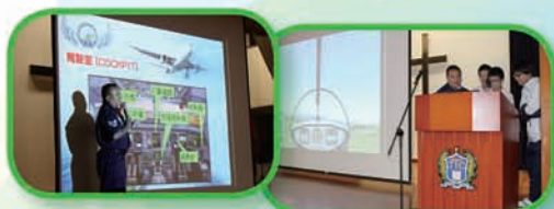
講員向學生講解飛機的結構

2017 年 5 月 2 日放學後，中一及中二同學在本校禮堂參加航空科學講座，他們除可認識飛機結構及獲得航空科學知識外，更可模擬駕駛飛機，一嘗駕駛飛機的樂趣。