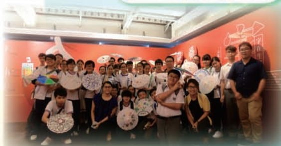
師生在饒宗頤文化館參與「漢字文化體驗活動」後留影