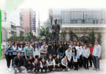
地理與歷史科考察 孫中山博物館