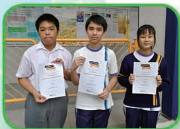
三位獲得優良成績的同學

2017年7月8日，數位中二學生前往調景嶺寶覺中學，參加由香港數理教育學會主辦之澳洲科學比賽，當中三位同學取得優良成績。