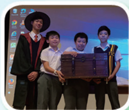
Treasure 2017 - The Winners

The English Treasure Hunt for junior form students was held in May 2017. More than 20 teams of highly energetic participants ran all over the school to complete tasks in designated stations in order to obtain clues to crack the final riddle and find the legendary treasure chest. English Prefects, with the help of all English teachers, served as emcees and co-ordinators to ensure smooth implementation.