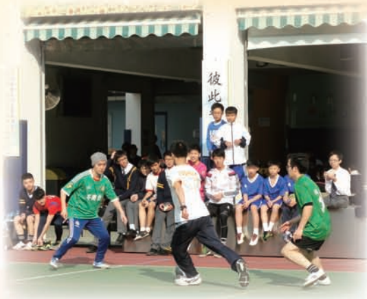
師生全情投入足球比賽

本年度師生足球比賽已於 2017 年 2 月 13 日舉行，當天所有比賽於下午六時完成，氣氛良好。