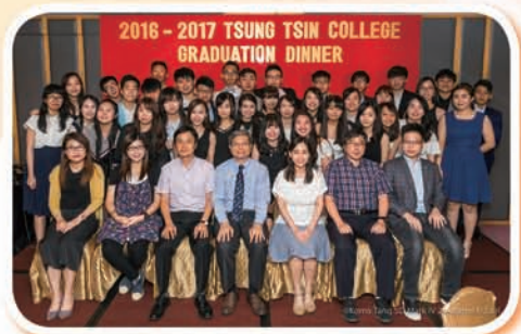
謝師宴——6A班師生合照

本校中六畢業同學於6月7日假尖沙咀馬可李羅酒店舉行謝師宴聚餐，超過132名師生參加，大家聚首一堂，共渡歡愉時光。