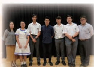
訪問《一念無明》導演黃進先生

本校為香港中文大學醫學院賽馬會公共衛生及基層醫療學院健康教育及促進健康中心的夥伴學校，於2017年4至8月進行先導活動，包括採訪活動及健康教育短片製作，擔任GoSmart小記者，構思有關健康及生涯規劃的提問，親身採訪醫療專業人士及青少年領袖；與中心合作設計健康教育短片劇本(片長約5分鐘)，並參與短片拍攝及製作。