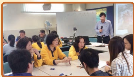
支援人員培訓活動

「促進學習資源發展基金」於 2014-2015 年度的籌款目的，是為了提升學校電子化教學。籌款方法有三：一元計劃、便服日及射籃籌款。便服日於 2015 年 2 月 12 日舉行，籌得 16,682 元；射籃籌款由師生共同參與，籌得 6,129.9 元；「一元計劃」是讓同學於便服日前 50 天，每天蓄起一元作為捐款，有關計劃籌得 5,830 元。三個活動合共籌得 28,641.9 元，有關款項現時已全數撥入「促進學習資源發展基金」用作補貼本校電子化教學的支出。為鼓勵同學積極參與而設的班際籌款比賽，結果由 2014-2015 年度的 1D、5D 及 4A 班分別取得冠、亞、季軍，在此多謝各班師生及家長踴躍參與，感謝各人同心支持以上的籌款活動。