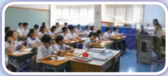
中一同學在英文課中用心聽講