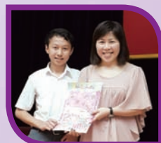
參與個人短講同學獲得獎項