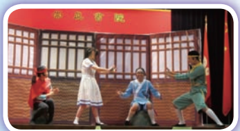
同學與演出者進行互動表演

為了讓學生認識性騷擾。本組邀請「森林聯盟」於4月21日到校演出話劇，向中二及中三學生講解性騷擾的定義及如何預防性騷擾。