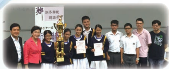
辯論隊奪冠後，與老師及頒獎嘉賓合照。

本校辯論隊參加本屆「新界聯校辯論比賽」，經過多輪賽事後，於七月十八日舉行的決賽中，以4:1票數擊敗對手，奪得是項賽事的總冠軍。