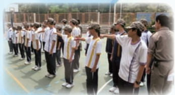
同學積極投入活動

為了幫助初中級學生提升自信心、抗逆能力、自理能力及團隊合作精神，本組於3月28日與「香港精英部隊培訓有限公司」合辦「逆戰行動」，共有二十七名中一至中二學生參加。