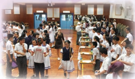
The English Treasure Hunt