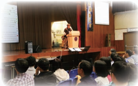
英文科主任分享運用資訊科技的教學心得

1. 3月中，本校再度與浸信會永隆中學，組織第三次聯校教師發展活動，主題是「自主學習的先決條件——學習動機」。其間，本校英文科主任及訓導主任精彩地分享了「提升學生課堂動機的策略」和「運用資訊科技的教學心得」。而兩所中學的教學同工，也一同分享有關擬定試題時的經驗，有效反思自己的教學工作。