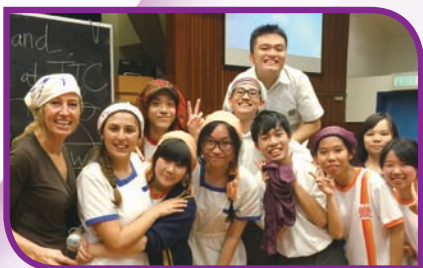
Our pirates in the English Treasure Hunt

The English Treasure Hunt for junior form students was held in May 2015. More than 20 teams of highly energetic participants ran all over the school to look for hints so as to complete special tasks. It was the first time this event being held in the hall, and it was a wonderful experience for all.