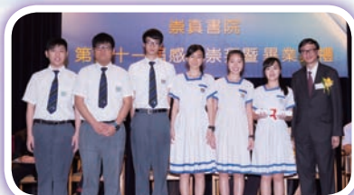
主禮嘉賓頒發畢業證書與中六畢業生