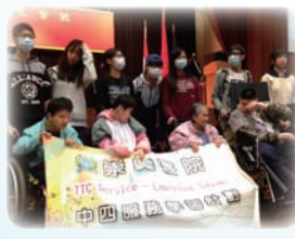
「扶康會」的院友與中四級學生一起遊戲

今年主題為「天生我才必有用」，透過課程讓學生明白神愛每一個人，造就每一個人，教導學生發掘自己才華，同時亦要欣賞他人。本組邀請「扶康會潔康之家」合作舉辦