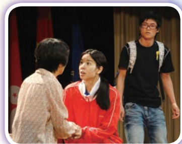
「六四舞台」蒞臨演出《我的孩子十七歲》

「六四舞台」蒞臨演出《我的孩子十七歲》，以話劇形式讓學生對中國歷史有更透徹的了解，並作出反思，明白國內民生及政制發展，他們的表演精彩，學生的反應良好。