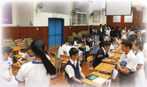
Over 1000 entries in the Word Champion!