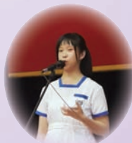
在聽說活動中同學演說的情況

本年度的聽說活動在五月舉行，對象是中一至中五級，主題是「愛人愛己，關顧社群」。各級的演說題目分別是「如何實踐「愛人愛己・關愛社群」的精神？」、「論推己及人的愛」、「『己所不欲，勿施於人』，你認同這句說話嗎？」、「『老吾老以及人之老，幼吾幼以及人之幼』一句在現今社會適用嗎？」及「『親親而仁民，仁民而愛物』能否應用在現今世代呢？」。期望透過活動，讓各演說者及觀賽者在日常生活中更多反思學校本年度培育主題，並在生活中實踐出來。各級演說的同學都有充足準備，無論在內容上及技巧上都有不俗的水準。