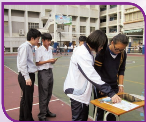
數學之王活動情況

本校於4月28-30日舉辦第十五屆中一至中三級「數學之王」大賽，讓同級同學分組協作比試。今年全場採用電子及雲端技術，加強比賽氣氛之餘，亦讓同學享受雲端科技學習的樂趣。