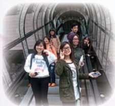
同學滿懷期待進入香港藝術館