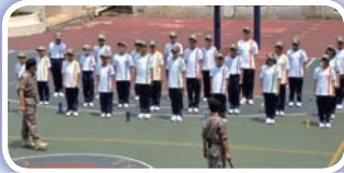
中一同學在操場集隊，參加「升中適應講課程」。

為了讓中一同學盡快適應中學生活，並強化他們的學習基礎，本校於8月24日至28日期間，舉行「中一橋樑課程」，所有中一新同學必須出席。橋樑課程舉行期間，中一新生須參加英文課程，以提升其英語水平；同時，透過各科組主辦的講座及活動，使中一新同學對本校的歷史及校園生活各方面的情況均有所認識，並漸而建立他們對學校的歸屬感。