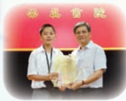
在橋樑課程中表現優異的中一同學獲頒發禮物