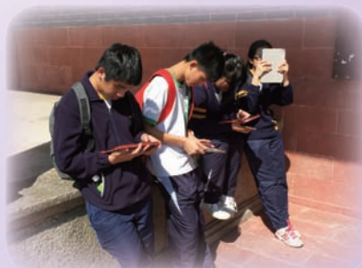
應用流動學習軟件