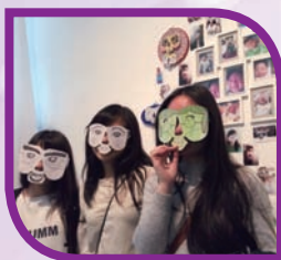
參觀伙炭開放日，同學與藝術品互動