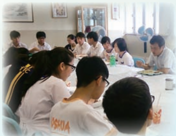
學生議員全情投入正、副校長飯局

本年度學生議員與正、副校長飯局已於2015年3月3日（中三及中四）及2015年5月7日（領袖生長、首席朋輩輔導員、學生會代表及六社代）舉行，當中主要討論內容包括修讀視藝科的同學希望延長視藝室開放時間、小食部員工工作態度、課室設備及學團的報名人數等。正、副校長即時按議員的提問作出回應，並承諾於短期內完成因應措施。溝通過程順暢。