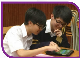
The use of IT in the Word Champion

The Word Champion, a vocabulary competition comprising a vocabulary game circuit in which students participate in various word games to compete for the highest scores to become the word champion of the school, was held in May 2015. The turnout for this program was unprecedentedly high, with over 1000 entries vying for the honor.