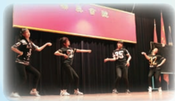
社際天才表演——現代舞

一年一度「天才表演」於7月3日舉行，當天分別以社際及團體形式比賽，各社盡派精英參加。結果由信社勇奪冠軍；亞軍、季軍分別為達社及義社。