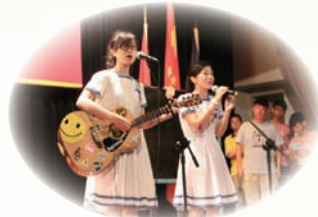
社際天才表演——女子合唱組合