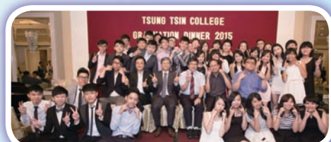
校長、各老師及 S.6E 班合照

本校中六畢業同學於6月16日假尖沙咀馬可孛羅酒店舉行謝師宴聚餐，師生超過180人參加，與應屆中六畢業班聚首一堂，共渡歡愉時光。