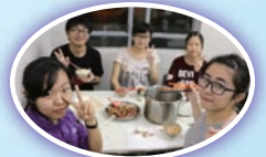
團隊精神更勝美食