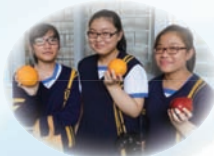
同學積極參加開心果日活動