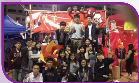
本校同學在年宵攤位前合照

本校經濟科及企財科舉辦了「年宵活動」，使學生能將理論運用於日常生活中，並取得營商經驗。經過撰寫計劃書及選拔後，本年度共有十五名學生以「隻羊無限好」為組名參與活動。學生在老師陪同下，到廣州購買貨品，並於學校開放日及新年期間進行銷售。活動完成後，學生還製作了分享短片，於電視早會播放，使其他同學都對經濟學概念有所了解。