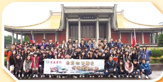
本校師生在台北國父紀念館前合照

本校中史科與地理科合作，於2011年12月28日至31日期間，舉辦「台灣歷史及地理考察團」，帶領七十六位中四至中五級學生前往台灣考察歷史名勝，參觀當地紀念辛亥革命一百週年的活動及考察台北市的城市發展及商業活動。