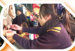
同學在年宵活動中 努力賺取回報