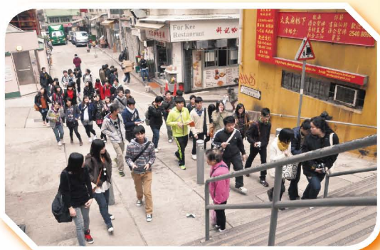
本校同學在中西區文物徑漫步

中史科與地理科合作，於2012年2月份舉辦「中、上環歷史地理考察活動」，帶領中五級修讀中史科及地理科的同學遊覽「中西區文物徑」，讓學生考察中、上環與辛亥革命有關的歷史遺跡及相關的文物保育情況，藉此明瞭香港與中國近代革命的關係。