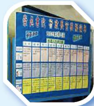
投票前，學生先了解各候選人政治理念和政綱，做足準備才投票哩。

投票當日，學生反應熱烈，投票總人數共有315人，投票率達33%，而模擬投票結果為：1號梁振英先生得96票(30.48%)，2號唐英年先生得31票(9.84%)，3號何俊仁先生得票98(31.11%)，棄權73票(23.17%)及廢票17張(5.4%)。「行政長官模擬選舉」亦引起學生對政治的關心及討論，他們擇善固執，敢於發言，活現了一個公民教育課節。