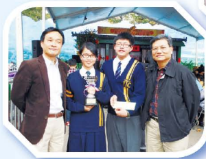
黎校長及杜副校長到場支持參賽同學。