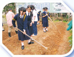
健康家族伊甸園有機耕種隊長用心教導隊員種植的技巧