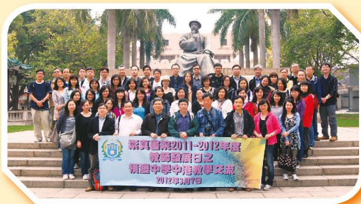
本校老師在林則徐銅像前大合照

教師發展組於2012年3月7日組織了一次「中港教學交流及歷史文化體驗活動」，本校校長與60位老師遠赴東莞，參觀了「林則徐紀念館」，使教學同工對我國歷史及文化有更深入的了解。此外，我們亦探訪了「橫瀝中學」，受到當地教育部、校長和各科組老師的熱烈款待，進行了不同科目之觀課交流；而其先進的教學設施及廣闊的綠色校園，使我們對現今內地中學之發展有更深入的了解，亦擴闊了本校老師的視野，此行實在獲益良多。