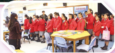
同學對本校健康中心甚有興趣