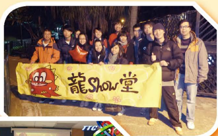
難忘的一刻！ 回憶只有在那 些年中……

在活動當中，同學們參與的工作包括：年宵攤位公開競投、到廣州作採購活動、計算成本及定出售價、宣傳及校園試賣、場地佈置及銷售等，整個活動由開始至結束歷時半年有多。在活動當中，同學們透過親身參與，以真實的銷售環境作為一個學習平台，從中學到產品設計、成本控制、銷售策略、團隊合作等知識和技巧。此外，這活動亦讓同學有機會發揮他們的多元智能及把商業、會計、設計與科技、家政及電腦等知識結合起來，從而應用於實際生活之上。