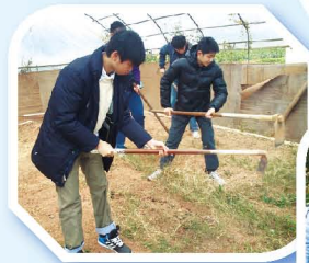
學生參觀「新生精神康復協會」建生村農圃，接觸田野，舒展身心。

為了幫助初中學生增加自信心及團隊合作精神，本校學生輔導組與「香港青年協會賽馬會建生青年空間」合辦「軍事歷奇領袖才能訓練」歷奇活動，共有41名中一至中二學生參加。