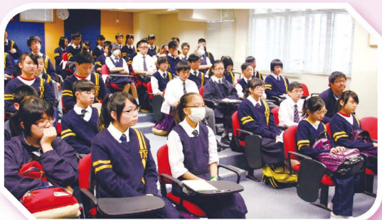
各議員細心聆聽校方回應