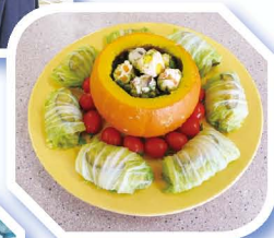
烹飪比賽作品名稱為「丸躍田園裡」。