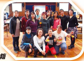
家長到場選購書籍