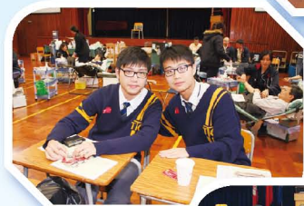
捐血救人， 是快樂之本