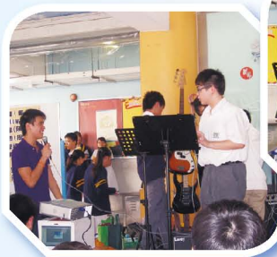
校園福音佈道活動