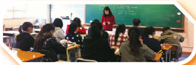
English Enrichment Class