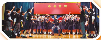
English Singing Contest