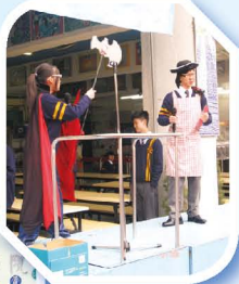
福音周開幕禮 (神的管家與魔鬼對峙)