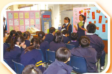
迎春接福好書分享會

圖書館於第二學期舉行不同主題的好書分享會，包括「音樂共賞」、「迎春接福」及「情深絮語」等。分享會由閱讀大使就不同的主題，以輕鬆有趣的方式，向參加者推介圖書館的館藏，增加同學對不同範疇圖書的閱讀興趣。