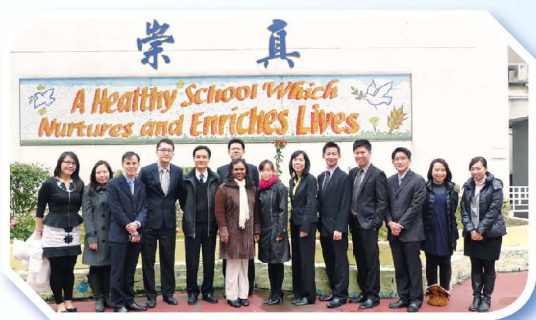
健康教育組負責老師與新加坡老師合照