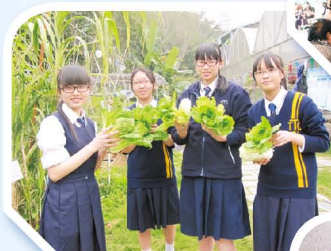
健康家族伊甸園有機耕種隊悉心培植有機蔬菜，供家政科同學參賞。