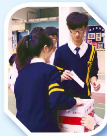
「一人一票」選出學生心目中的特首。

今年，德育及公民教育組的主題為「身、心、社、靈健康」，強調愛自己，愛他人。透過Service-Learning Scheme課程，讓學生了解精神病患的成因及學習情緒管理，並有機會參觀「新生精神康復協會」建生村農圃，接觸田野，親身一嘗「晨興理荒穢，帶月荷鋤歸」的味道，與精神復康者一起製作有機肥皂及香草曲奇，藉以傳揚「推己及人」(馬可福音第12章30節)的基督精神。