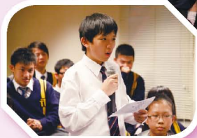
議員代表各班向校方提出意見