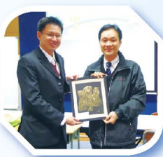
新加坡的學校代表向杜副校長致送當地學生的雕刻作品，作為紀念。