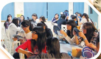
同學在天文課程中學學習觀日方法