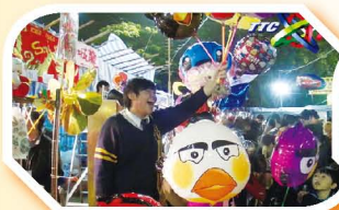
同學們積極地銷售 各式各樣的产品