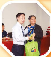
黎校長與橫瀝中學校長交換紀念品