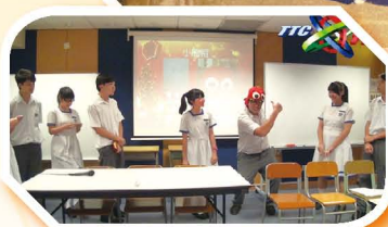
同學於年宵產品設計比賽 匯報中施展渾身解數