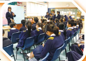
情深絮語好書分享會