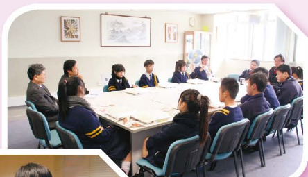
正、副校長與學生議員共晉午膳，氣氛融洽

此外，學生議會於本學年繼續推行「正、副校長與學生議員共晉午膳計劃」，由正、副校長分別與各級學生議員、學生會幹事、正、副領袖生及首席朋輩輔導員一同共進午膳。期間，各人就校園生活、校政安排等相互交流，坦誠分享意見，氣氛融洽。