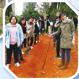
請不要小覷女孩子啊，經大家合力開墾後，井然有序的田埂就出現了。